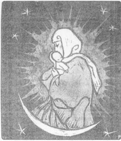
Matka Boska Księżycowa, ok. 1948-1949, linoryt kolorowany akwarelą na papierze.