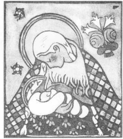
Matka Boska Karmiąca ok. 1948, linoryt kolorowany akwarelą.