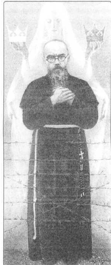
Ojciec Maksymilian Maria Kolbe, 1962, olej na płótnie(?), inne dane oryginału nie są znane.