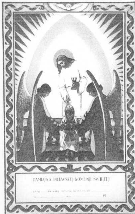
Pamiętka Pierwszej Komunii Świętej, ok. 1938, druk na kartonie, obrazek wydany przez „Księgarnię Św. Wójciecha” w Poznaniu.

Królowa Jadwiga, 1953, druk na kartonie, obrazek wydany przez Komitet Popierania Beatyfikacji Królowej Jadwigi w Wielkiej Brytanii.